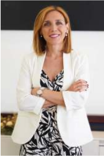
Candelaria Testa Romero Alcaldesa de Alcorcón

El Ayuntamiento de Alcorcón incluye entre sus principales líneas estratégicas: el bienestar integral de los niños, niñas y adolescentes —objetivos generales que guían todas las decisiones de nuestra administración.